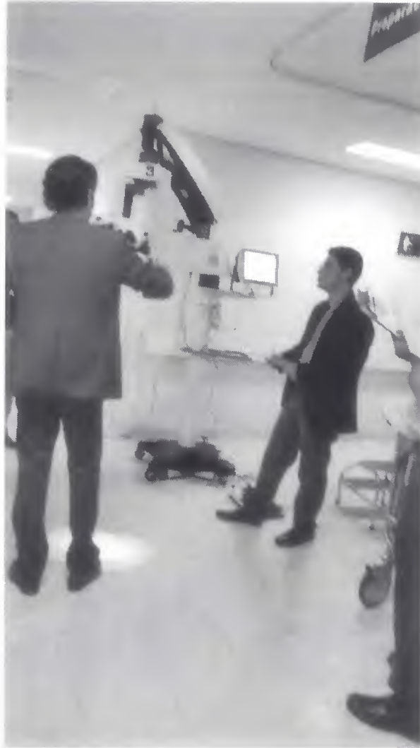
Microscopio para Oftalmo-cirugía de Alta Especialidad Marca: Leica Modelo: 822 F40

También asistieron a la demostración las siguientes personas: