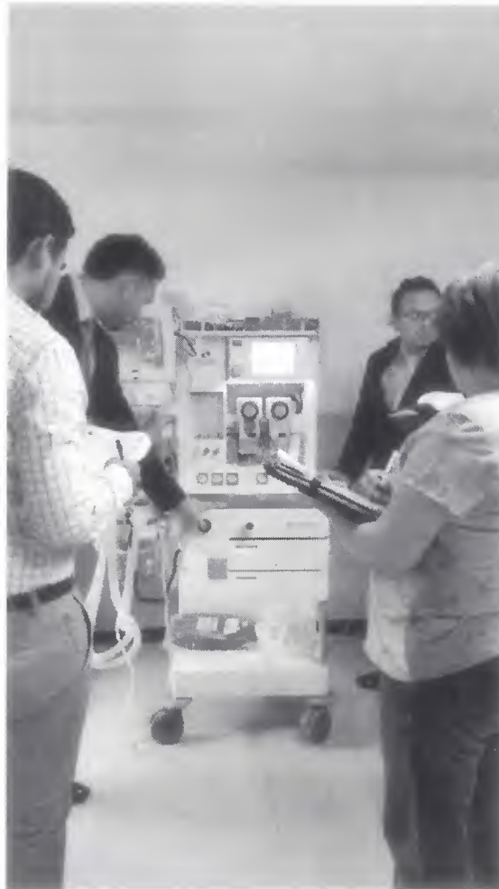
Unidad de Anestesia Intermedia Monitor Marca: Spacelabs Healthcare Modelo: Focus