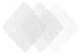
Claves Requeridas por Rango de Importes Totales